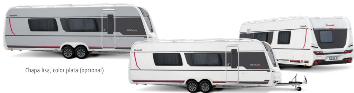
Chapa lisa, color plata (opcional)