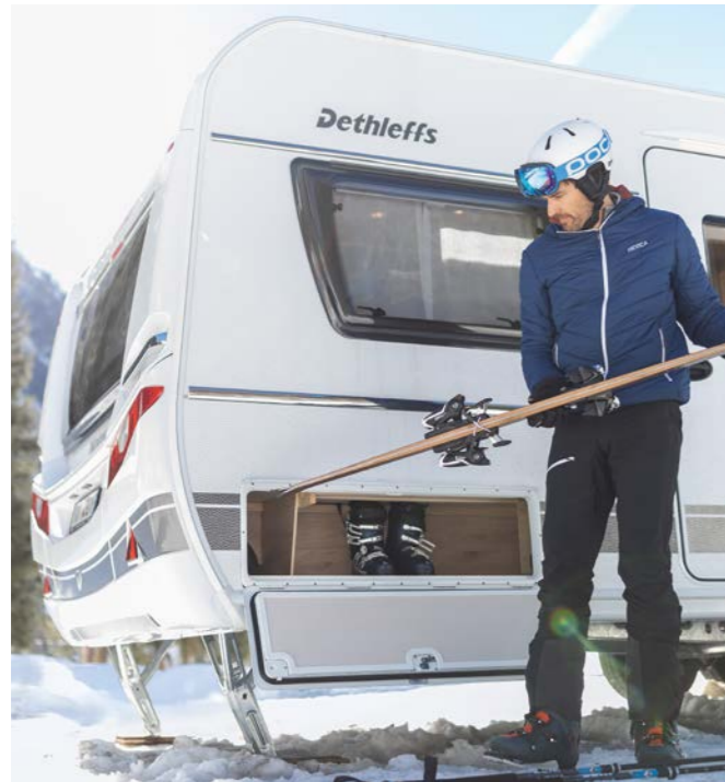
¡Disfrute de un apartamento de vacaciones justo al lado de las pistas de esquí, con un interior tan acogedor y cálido como en casa!

Con este equipamiento, basado en años de experiencia, su caravana se mantendrá cálida y acogedora, incluso en las noches más frías, sin que la instalación de agua se congele.