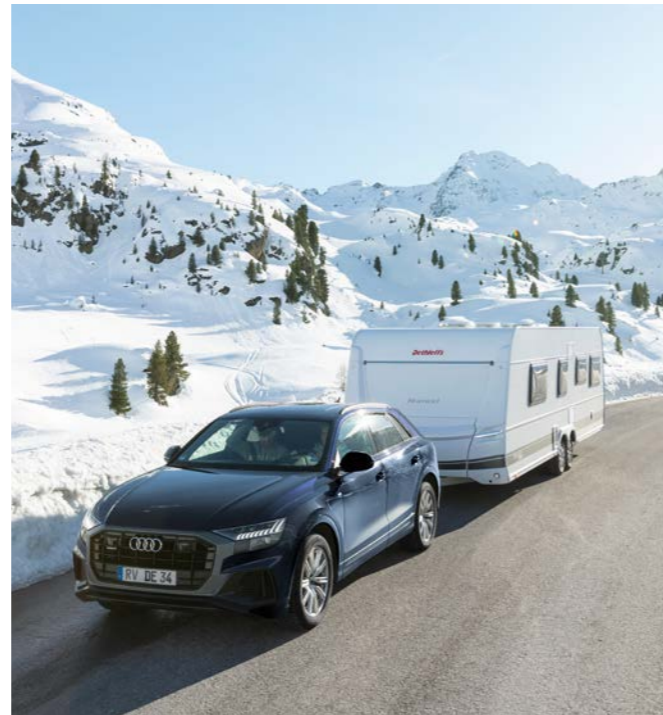
Máxima seguridad durante el invierno con una caravana Dethleffs equipada con los Winter Comfort Pakets opcionales.