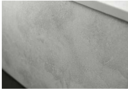
Diseño del mobiliario