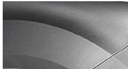
Gris Magnetic metalizado