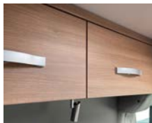
+ Mobiliario Cape Town