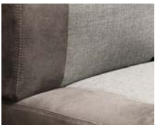
+ Tapicería Hygge