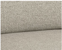
+ Tapicería Kari