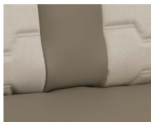
+ Tapicería Nubia