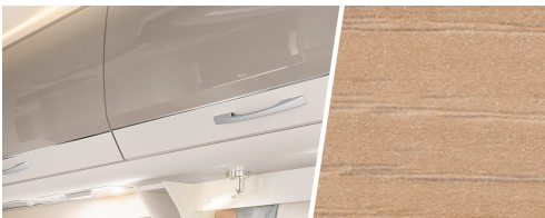
+ Mobiliario diseño Nogal Nagano