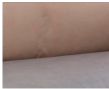
+ Tapicería Duke