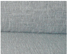
+ Tapicería Drake