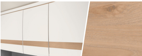
+ Mobiliario diseño nogal Nagano