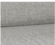
+ Tapicería Samir