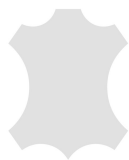
+ Tapicería de piel Individual