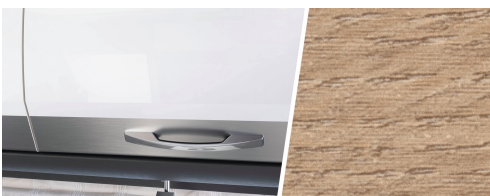
+ Roble Amberes