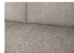
Saros (de serie)