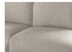
Heron: con detalles de polipiel (opcional)